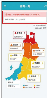
▶ 画面の例。より詳細な地域を設定することもできます。