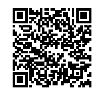
▲自衛官募集ホームページはこちら

自衛隊福島地方協力本部では自衛官(高等工科学校生徒)を募集しています。詳しくは自衛官募集ホームページ、または左記まで問い合わせください。また、自宅などの個別説明にも対応していますので、希望する場合は気軽に相談ください。