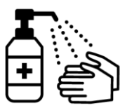
手指消毒用アルコールによる消毒の励行