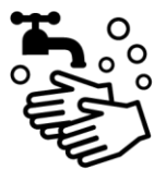
石けんによる手洗い