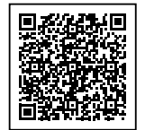
▲申し込みはこちらから