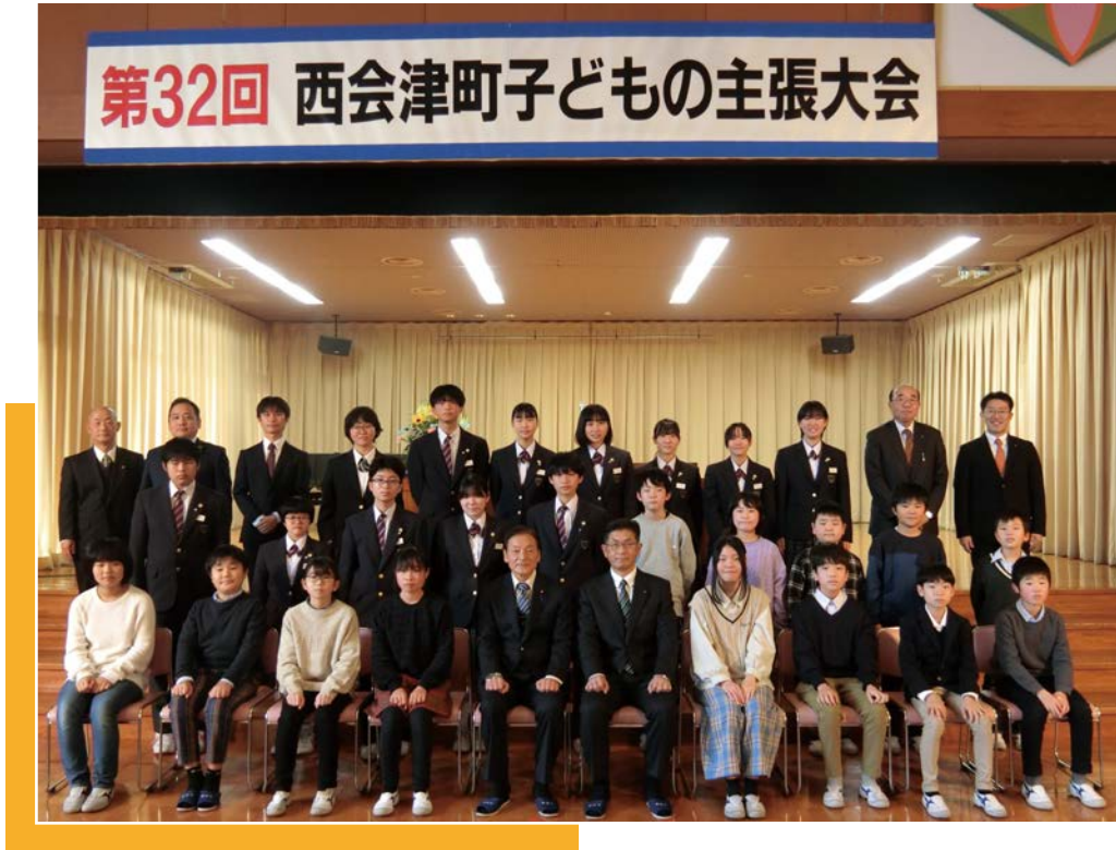
◀終了後の記念撮影