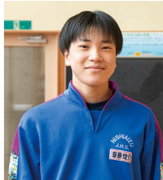
[ 2年・生徒会 会長 ]