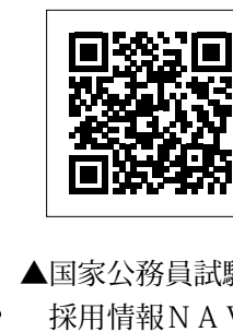
▲国家公務員試験採用情報NAV I