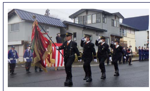
地域を守る消防団 (1月7日消防出初式より)