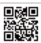
▲QRコードを読み取り、案内ページの指示に従い登録してください。

登録は無料で、左記のQRコードを読み取るか、メールアドレスに空メールを直接送って登録ができます。