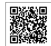
▲町ホームページはこちら