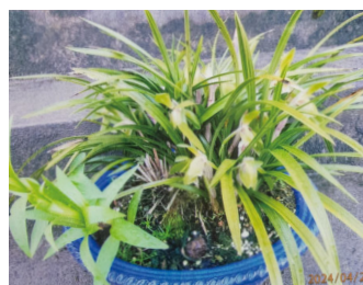
▲ シュンラン