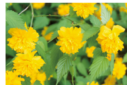
安座の風景 (令和6年5月撮影)

静岡県出身。大学卒業後、青果売り場の導入・運営をサポート。現在は新郷連絡所にある町農業公社で活動。