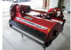
トラクター装着型▶