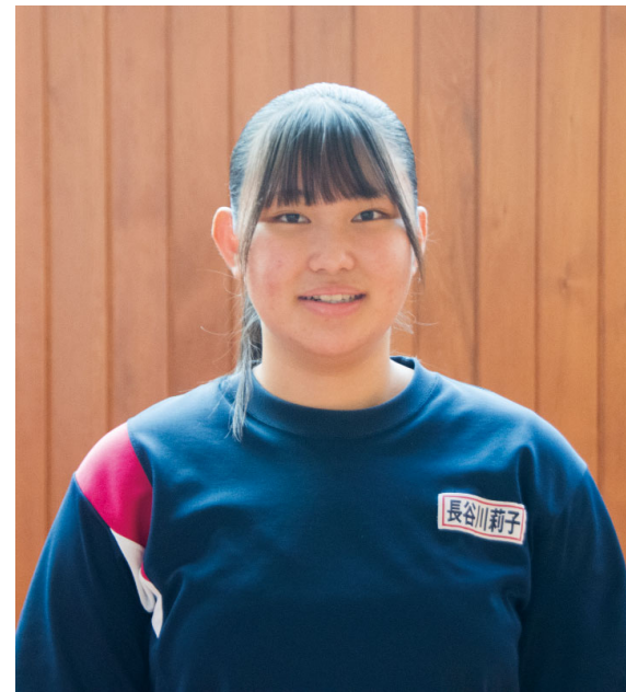
[ 西会津中3年・保健委員長 ]