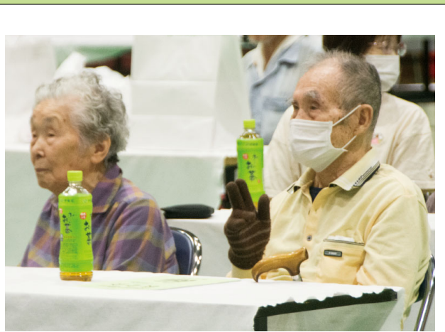
▲令和6年度野沢・尾野本地区敬老会より 西会津大山さゆり太鼓の演奏に合わせてリズム を取る参加者