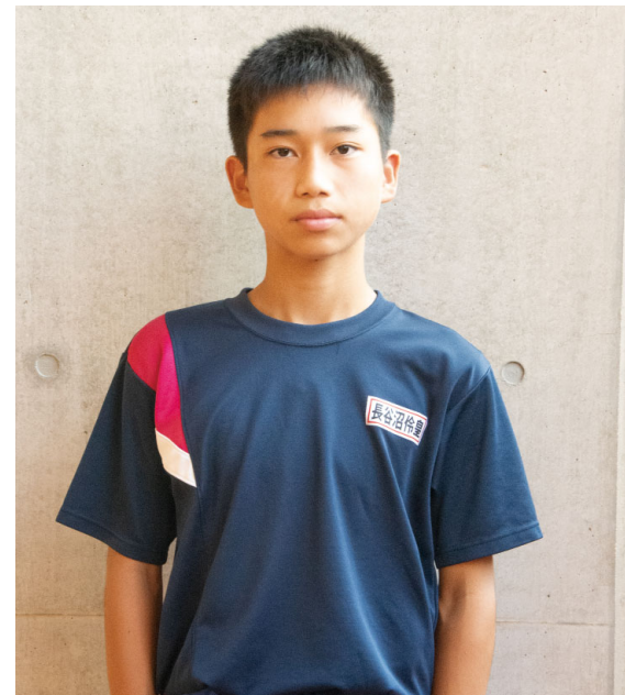
[ 西会津中3年・駅伝部部长 ]