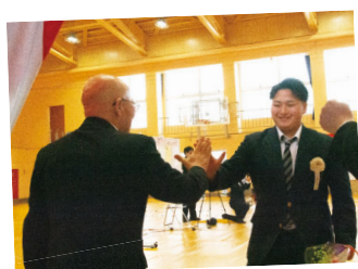
3月1日に行われた、西会津高校卒業式より