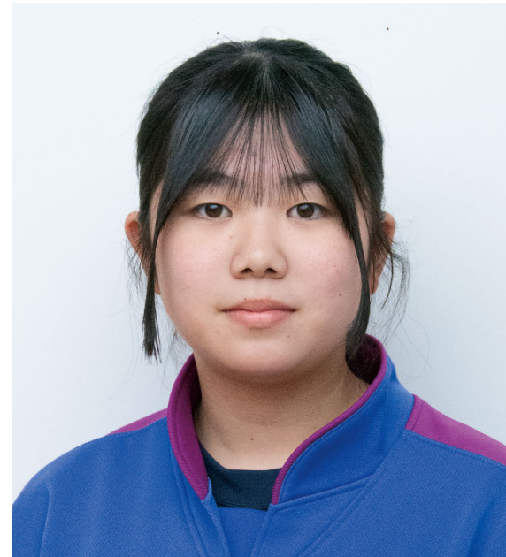
[西会津中 3年・剣道部 部長]