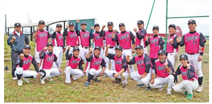
▶ 来年の初勝利を誓う選手の方皆さん