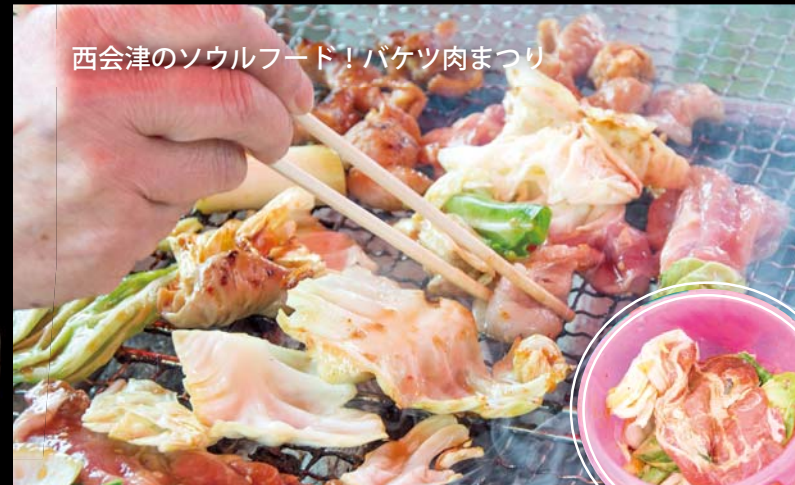
西会津のソウルフード! バケツ肉まつり