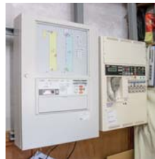
【写真上】自動火災報知器