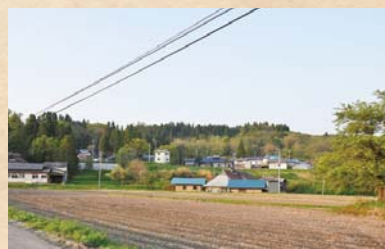
↑現在の高目の新屋敷付近