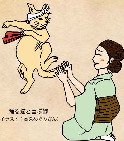
踊る猫と喜ぶ嫁 (イラスト：高久めぐみさん)