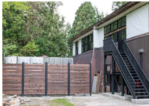
【写真下】芸術村の裏手に設置したスプリンクラーの受水槽と非常階段