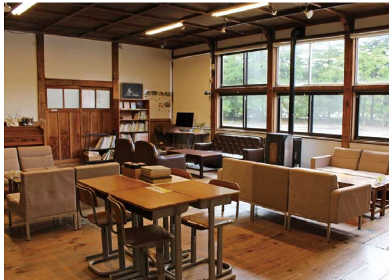
【じぶんカフェ】全20席、お湯あり、Wi-Fiあり、全館禁煙

カフェのふりした 無料休憩所「じぶんカフェ」 芸術村には、「じぶんカフェ」という無料休憩所があります。飲みたい物、食べたい物を持参して好きな場所に座るだけ。お気に入りの場所を探してください。 読書をしたり、お茶を飲んだり、おしゃべりしたり、コワーキングスペースとしての使用もOKです。