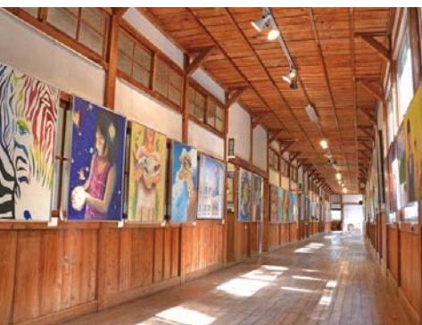
【写真】公募展の様子

芸術村では、NPO法人や地域住民の皆さんが実行委員会を結成し、平成18年から「西会津国際芸術村公募展」を実施しています。