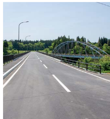
完成した橋屋橋（右奥は旧橋屋橋）

ました。橋長185㍎、全幅8.5㍎で対面通行でき、歩道も整備されました。一方が通り抜けるまで待たなければならなかった旧橋屋橋に比べ、通勤・通学にかかる時間の短縮が期待できるほか、歩行者も安全に通行できます。