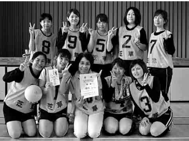
▲家庭バレーボールで優勝した野沢チームの皆さん

7月7日、野沢・尾野本・群岡・新郷・奥川の地区対抗で競う五地区対抗球技大会をさゆり公園体育館で開催しました。 (主催：町体育協会・町公民館) 競技種目は、ソフトボール、家庭バレーボール、バドミントン、卓球の4種目ですが、ソフトボールは雨のため、卓球は出場チームがなかったため中止になりました。 家庭バレーボールには野沢・尾野本・群岡の3地区が出場し、総当たり戦で競技を行いました。その結果、各試合とも接戦を制した野沢が優勝しました。