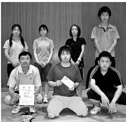
▶バドミントンで優勝した野沢チームのメンバー