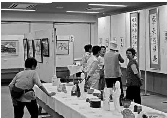
▲新潟県や宮城県からも来場者が