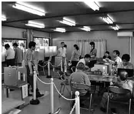
◀込み合った役場隣の期日前投票所

参議院議員通常選挙は7月4日に公示、町長選挙と町議会議員補欠選挙は7月16日に告示され、それぞれ、その翌日から期日前投票が始まりました。今回は3つの選挙が重なったため、4つの投票箱を使う大規模な選挙となりました。投票は、21日午前7時から町内20カ所の投票所で一斉に始まり、午後6時（中央投票所は午