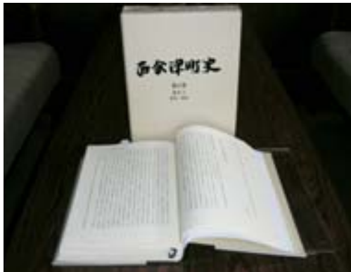
西会津町史 第2巻Ⅱ（近代・現代）

西会津町史では「第2巻通史Ⅱ（近代・現代）」にこのことが詳しく書かれています。この機会にぜひ町史を読み、当時に思いをはせてみてはいかがでしょうか。