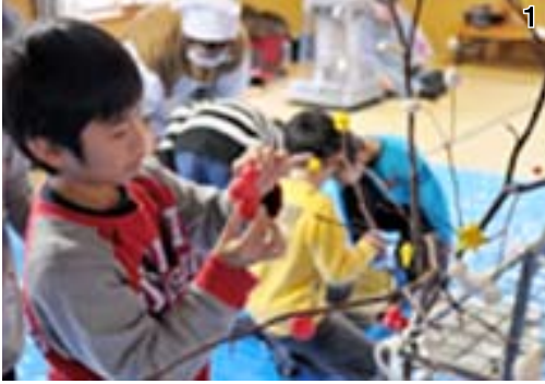
1_群生っこクラブ 2_野沢たけの子クラブ・おのもと桐っ子クラブ 3_奥川クラブこめらっ子

参加した子どもたちは、安全管理員さんなどから「だんごさし」の由来やだんごのこね方を教えてもらいながらだんごを作り、ゆで上がったらだんごと鯛や小判を模した縁起物をミズキの木に飾りました。飾り付けの後は、だんごにあんこやきな粉を付け、みんなでおいしく食べました。