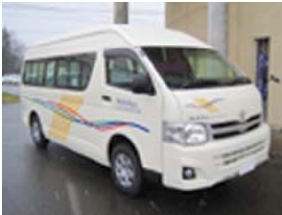
デマンドバスで使用する車両（同型車）

見つけることができます。近くの乗降場所やこれまでの利用状況なども確認できるので、予約を早く・簡単に済ませることができま 予約は「デマンドバス予約センター」で受け付けます。