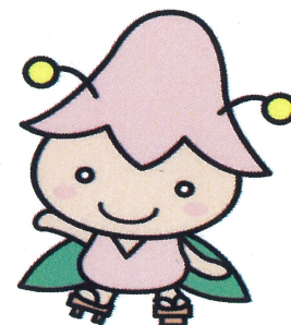
西会津町キャラクター「こゆりちゃん」