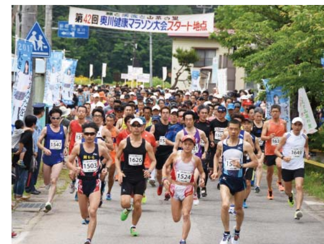
写真=第42回大会(昨年)の様子