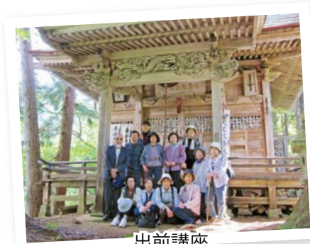
出前講座 「極入・お聖天様について学習」

平成30年度の主な公民館講座や教室を紹介します。詳しい内容や申込手続きについては、各世帯に配布するチラシやケーブルテレビをご覧ください。皆さんの参加をお待ちしています。