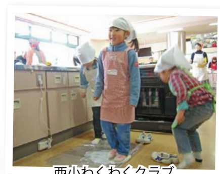
西小わくわくクラブ 「手打ちうどん作り」