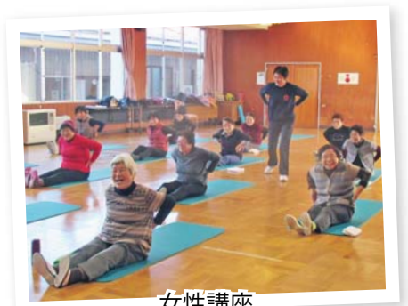
女性講座 「健康教室」