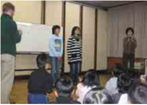
子どもコース まとめ役のお姉さん よろしくお願いします