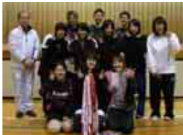
3連覇の日本チャチャチャチーム

優勝 日本チャチャチャ 第2位 N.V.C.Team上小島 第3位 べちりこ ちょこたん