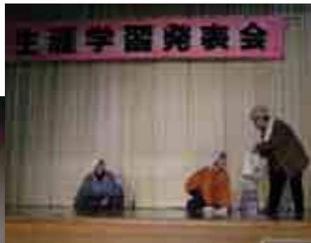
家庭円満の方法が分かりました(寸劇:町赤十字奉仕団)

カラオケと新舞踊の飛び入りやダンスと寸劇など、新たな分野に挑戦する出演者の旺盛なチャレンジ精神が、訪れた100名の皆さんに伝わり、会場全体が活気づいていました。