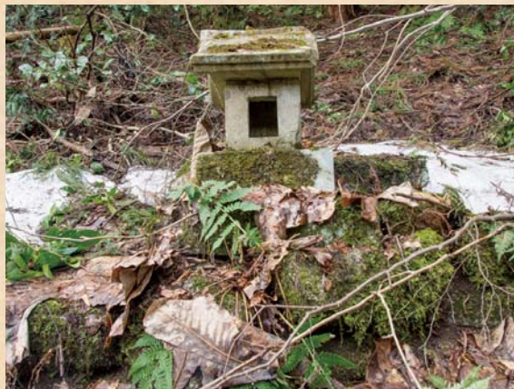
↑東端に祀られている「上の蛇神様」

蛇はその形から古来より恐れられ、神聖な動物として崇められてきました。全国的に祖霊、水神、山の神、田の神として祀られています。徳沢地区には、集落の東西の端にそれぞれ蛇神様が鎮座しています。東端、上の蛇神様は会津の中で特に有名で、江戸時代に会津藩によって編さんされた『新編会津風土記』には「蛇石、村の東約60間（約109 間 ）にあり高さ3尺（約90センチメートル）、幅5尺（約1.5 間 ）ほどの黒色の石なり。