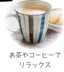
お茶やコーヒーでリラックス