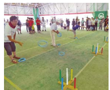
↑輪投げ（尾野本地区）