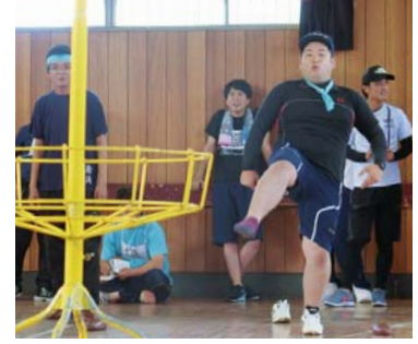
↑これはたまゲタZu（奥川地区）

戦」など7種目で競い合いました。恒例の縄ないリレーでは、巧みな手さばきで8m23センチの長さの縄をなつた（編んだ）チームもありました。優勝 笹川B、第2位 笹川A、第3位 富士B