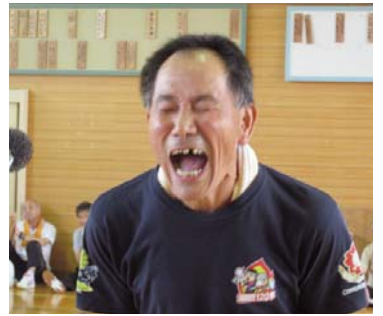
↑大声大会（群岡地区）

第51回群岡地区体育祭は旧群岡中学校体育館で開催し、6チーム約220名が参加しました。声の大きさを競う「大声大会」や「荒かせぎジャンケンポン」などユニークな競技で競い合いました。体育館での開催となりましたが、会