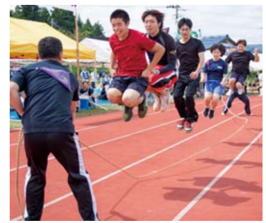
↑まざらんしょ（野沢地区）

第57回野沢地区親善大運動会は、西会津中学校第一グラウンドで開催し、15チーム約400人が参加しました。どの地区も気合十分！ラグビーボールを転がす「おらのぼーろどごさいぐだー」や「まざらんしょ（縄跳び）」など、