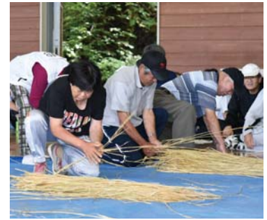
↑縄ないリレー（新郷地区）

場が狭い分間近で観戦できるので、競技だけでなく応援にも熱が入りました。優勝 上野尻A、第2位 上野尻C、第3位 大字屋敷