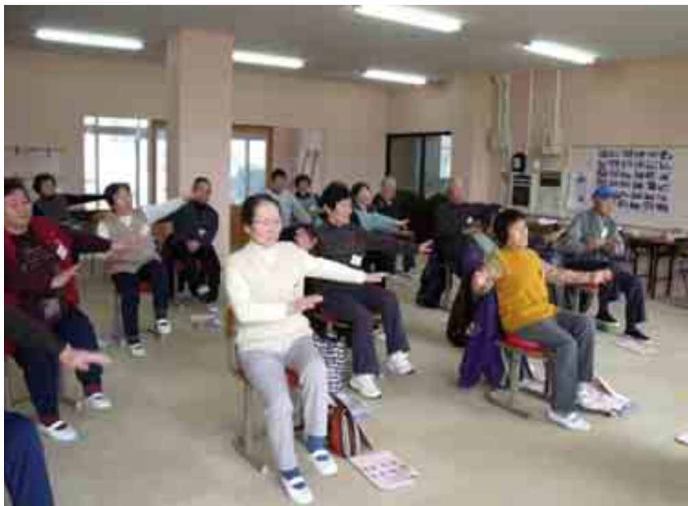
健康寿命延伸事業（運動教室）