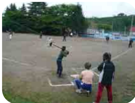
新郷地区球技大会