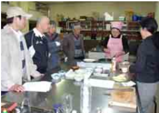
男性の参加者も積極的に調理の見学をしています

町では特定健診の後、生活習慣病の予防のために、ヘルスアップ教室を開催しています。この教室は健診結果について理解を深め、その後生活習慣を無理なく改善できるよう支援していくものです。 教室の対象となるのはどんな人？ 特定健診の結果により、生活習慣病の危険度を3段階に分け、対象となる方へは健診結果にチラシを同封しています。