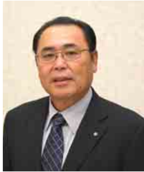
西会津町長 平藤 勝

私は、このたびの町長選挙において、多くの町民の皆様のご支援をいただき、町政運営を任せていただくことになりました。今回の選挙結果である「1,287票」の差は、ただ単に「私が選ばれた」ということではなく、選ばれたのは「町政を大きく変える」というその期待感であると、改めて私に課せられた使命と責任の重大さを痛感しているところです。 申すまでもなく、「町長」という職は、私、個人のものではなく、町政を担う役割を町民の皆様から4年間、負託されたに過ぎません。人は往々にしてある地位に就くと、まるでその地位があたかも自分への権利、