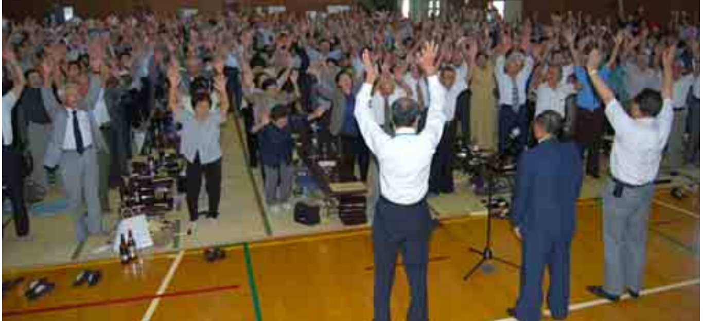
野沢・尾野本地区敬老会