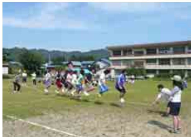
呼吸を合わせてソーレ！