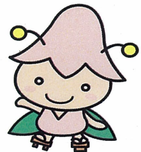
西会津町キャラクター「こゆりちゃん」