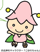
西会津町キャラクター「こゆりちゃん」