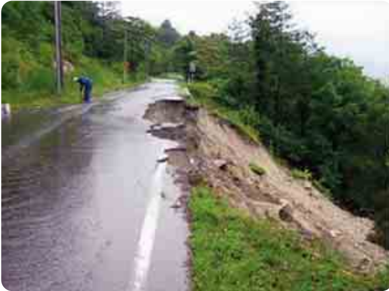
町道野沢柴崎線の道路決壊（戸中）