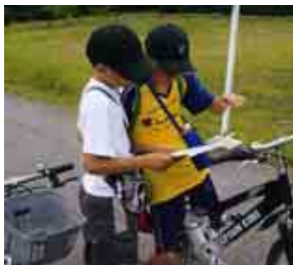
次の目的地はどこだ?

新郷チャレンジ教室では、7月8日(土)に新郷地区内の史跡や名所を通り、チームワークや決断力を養うことを目的とした「自転車版ウォークラリー」を実施しました。新郷地区の地形は起伏が大きく、上り坂では遅れる子もいましたが、一緒に歩いたり休憩したりと、協力しながら一生懸命ゴールを目指しました。