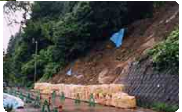
県道上郷下野尻線の法面崩落（滑沢）