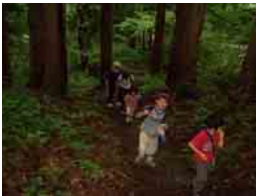
本社目前で、余裕の笑顔! (杉並木)

当日は、あいにくの小雨模様でしたが、5歳から80歳までの参加者39名は、往復8kmの大山路を堪能しました。