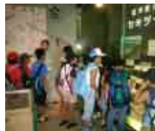
昔の生物 (こんな化石がでたのか...)

参加した学級生は資料館で化石を見学した後、実際に資料館の場で会津化石研究グループ会員の指導のもと、発掘体験し、宝を探すように貝や魚の化石を掘り当てていました。