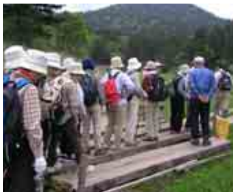
湿原植物を学習し、大自然を満喫

今後も更に教養講座等に参加し広範囲に学び、できる限り自分のものとして、修得するものを見出せればと思います。私自身の無力にむちを打ちながら、また期待しながら、今後の教養講座に出席したいと思っています。