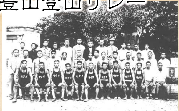
↑飯豊山登山リレーの記念写真

今から86年前の昭和8年(1933)8月、「第1回飯豊山登山リレー」が開かれました。これは旧会津藩主宍保公の七男松平保男子爵を総裁とする「飯豊山保勝会」が主催したもので、スタートを山都小学校、ゴールを奥川小学校とし、踏破総距離は15里12町(60.2 キ )、12名の選手がリレーし、予定所要時間8時間、選手は耶麻郡在住の身体強健な16歳以上の青年・在郷軍人とするものでした。標高差約2,000 尺 、難所も多く山岳リレーとしては最高難度でした。参加チームは、一ノ木A・B、関柴、木幡、慶徳そして奥川の6チームで、奥川チームは、弥平四郎より8人、小屋・梨平・小山ほかより各1人の選手での構成となりました。