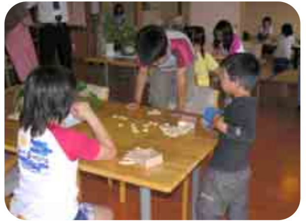
みんな仲良く、楽しく遊びます

子どもたちは、家庭で過ごすのと同じように、くつろいだり、おやつを食べたり、宿題をしたりしています。子どもたちにとってこのクラブは「放課後の生活の場」そのものなのです。