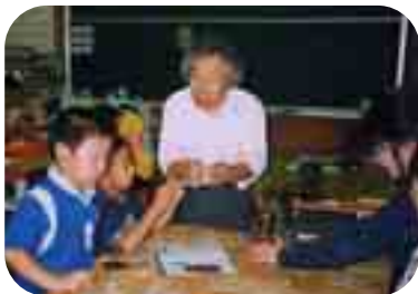
キッズアートクラブのようす