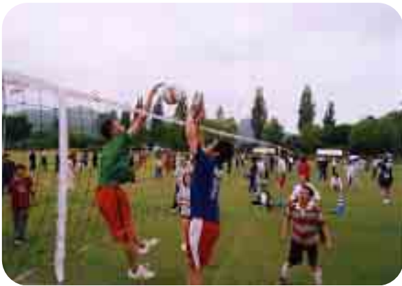
アタック 1 (尾野本地区町民バレーボール大会)

町内外から訪れた4千人のファンの中には、うらやましそうに見つめる人、写真に納める人で、会場は大賑わいでした。