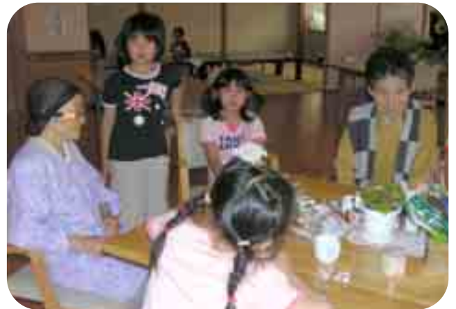
おじいちゃん、おばあちゃんとも仲良しです