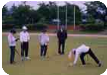
高齢者学級の交流会のようす

普段は交流の少ない、歳百合学園スポーツ講座生と新郷けやき学級生がお互い和気あいあいとグランドゴルフを行い、心地よい汗を流し、お互いに交流を深めました。