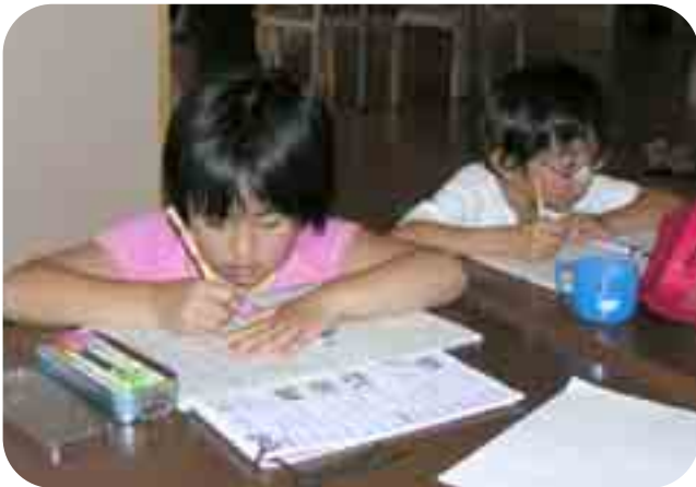
宿題だって一生懸命がんばります

で発表する機会を設ける予定です。 また、中学生が来てサッカーを教えることもあります。子どもへの接し方もうまく、大人気です。特に男の子たちは、中学生が来るのを心待ちにしているようです。 このような様々な人との交流が図られるのもひだまり子どもクラブの特長です。