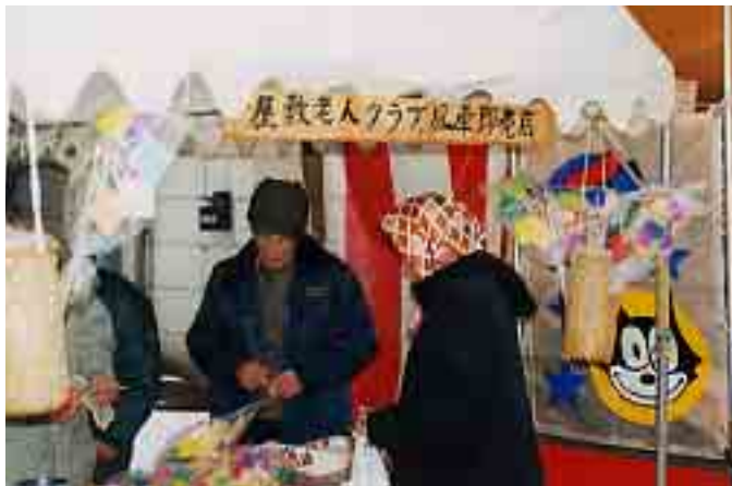
野沢初市の名物となった屋敷高齢者学級の風車即売

屋敷高齢者学級のみなさんは、「買いに来てくれた方との交流を楽しみに、毎年頑張っ作っています。今後も出来る限り続けていきたい。」と抱負を語ってくれました。