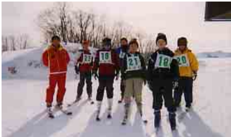
これから急斜面に挑む緊張が、顔に表れています

雪というと、克雪や耐雪など、それと闘うイメージが付きまといますが、公民館では今後もスキー教室やスノーボード教室を中心に、雪を楽しむ「楽雪」を奨めていきます。