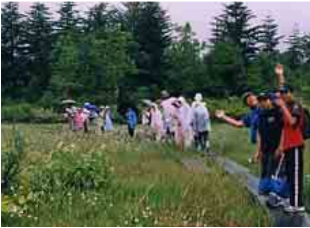
咲き誇るワタスゲに囲まれて

今回の活動は、初夏のこの時期に、水芭蕉が咲き、ワタスゲが風に揺れる駒止湿原の幻想的な自然と、江戸時代の宿場の町並が現存する大内宿を体験し、『自然を愛し、文化遺産を大切にすること』の育成を目的としています。