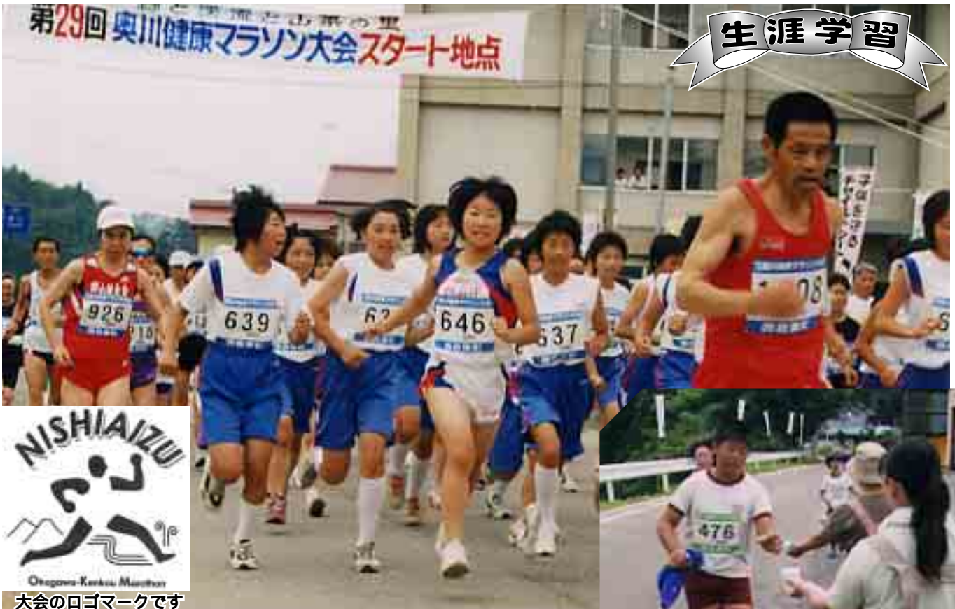
大会のロゴマークです