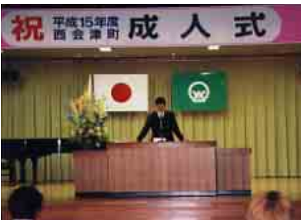
昨年の成人式から

申込締め切り後に受け付けした方については、成人式名簿に氏名等が記載されませんので早めにお申し込みください。また、対象者が町外に在住している場合には、本人の意思を確認のうえ、ご家族の方がお申し込みください。