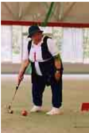
よくねらって(群岡地区)