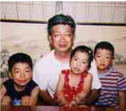
3人のお子さんと一緒に

3人のお子さんが笑顔で「大好き」と答えてくれたように、常に子どもたちを優しい目で見つめていました。