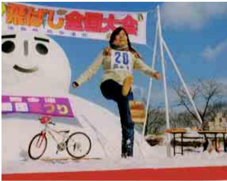
◀ 桐ヶ谷飛ばし全国大会