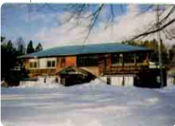
好きな西会津の風景(場所)は？ 旧高陽根分校校舎の眺め (当時の仲間、同級生の声が聞こえてくるようで、私にとっては思い出の詰まった至の校舎です)

あなたの特技は？ 手話です。Uターンする前、埼玉で10年ぐらい手話サークル活動をしたことがあります。 最近感動したことは？ 喜多方のとある横断歩道で小学生数名を渡してあげたとき、深々とおじぎされ、その礼儀正しさに感動しました。