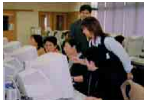
楽しくキーボードにタッチ・パソコン講座 (女性講座)