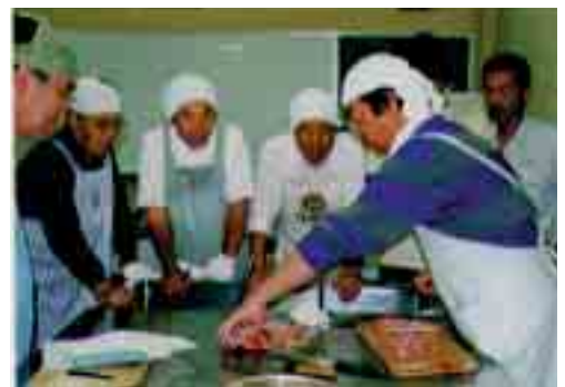
鯉こく、鯉のあらいに挑戦 (男の料理教室)