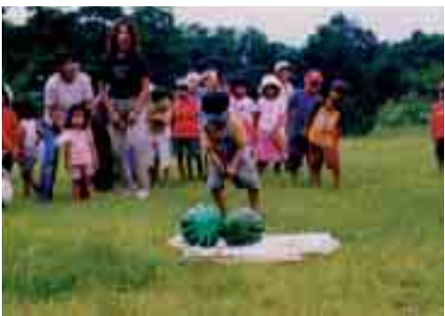
お父さん・お母さんとみんなと仲良く楽しくスイカ割り (親子でバーベQ・子育てサークル)