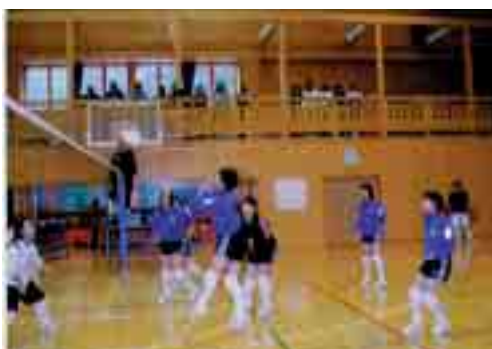
中学生のがんばった大会でした (初開催のバレーボールフェスティバル)