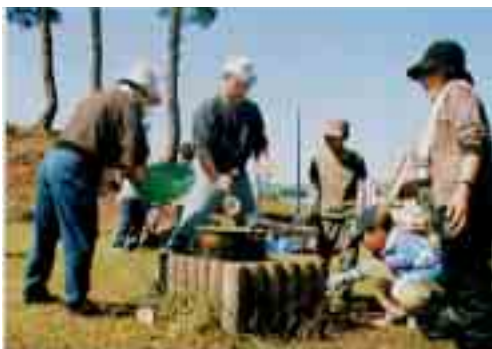
人生の先輩と野外活動体験・世代交流会 (ふるさとふれあい教室・わんぱく塾)