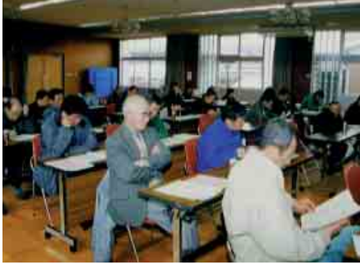
2月10日に開催された野沢・尾野本地区農事連絡員会議(生産調整配分率などの説明が行われました)

昨年十二月、政府は全国を生産調整面積を六万ヘクタール増やし、一〇六万ヘクタールにすることを決定しました。これに伴い、町に対して昨年より二一ヘクタール多い、三七四ヘクタールが配分されました。本号では、生産調整の配分率や助成制度の変更点などについてお知らせします。