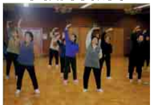
冬季の運動不足解消・太極拳体験 (歳百合学園)

豊かな生きがい づくりに向けて 平成14年度のまとめ 公民館では、生きがいづくりを求めているみなさんにこたえるため、さまざまな学習の場を提供しています。年