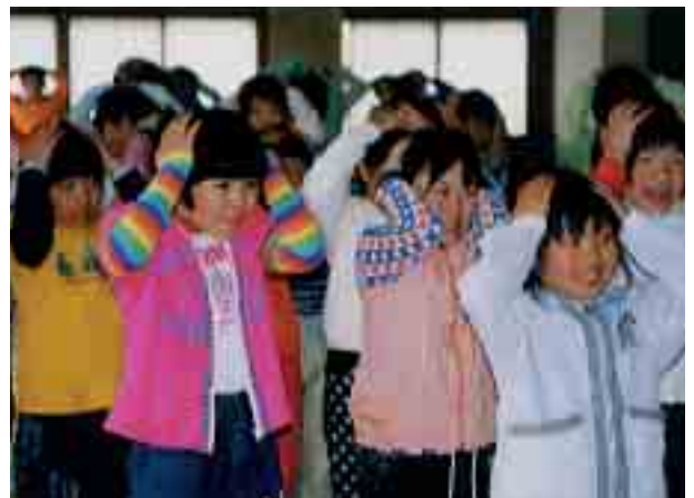
みんなで楽しくゲーム(わんぱく塾)

わんぱく塾は69名、ふるさとふれあい教室は34名、キッズアートクラブは28名の応募があり、開講式では、年間計画の