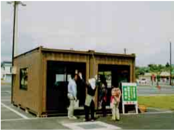
オープンへ向け準備が進められていた直売所の様子

直売所には、現在五十九名が増えた町内各地区の普及会員のみなさんが毎日出荷する旬のいろいろな朝取り野菜のほか、生食ハーブや農産加工品、山菜なども並び予定です。ぜひお出かけになって、地元で健康な土から生産された、安全、安心でミネラル豊富なおいしい新鮮野菜を