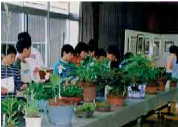
丹精を込めた野草に感心(ふるさとふれあい教室)

小学3～6年生を対象とした「にしあいつわんぱく塾」「ふるさとふれあい教室」の開講式が5月11日(土)・公民館にて行われました。さびには5月18日(土)には、新規事業「キッズアートクラブ」の開講式も西会津中学校校技術美術室において行われました。これらの講座は、4月から始まった完全学校週5日制に対応するもので、年間の学習をおして少年の健全育成を図ることを目的としています。