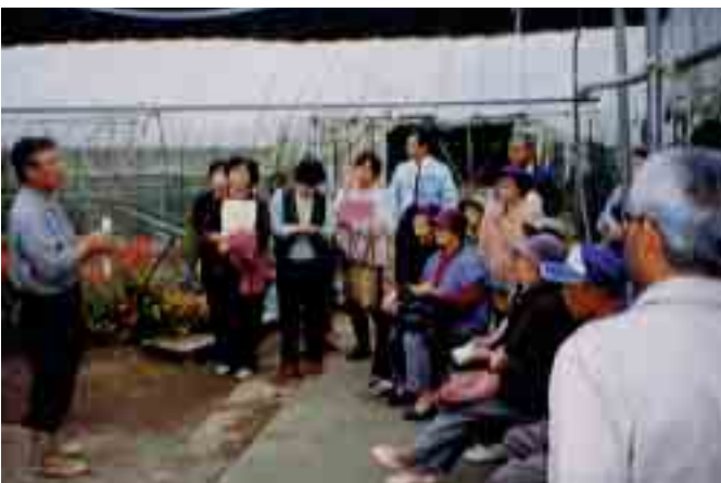
平成13年度養成講座 先進地視察研修の様様

なお、募集定員は三十名程度です。養成講座の受講を希望される方、また詳しい内容については、農林課にお問い合わせください。