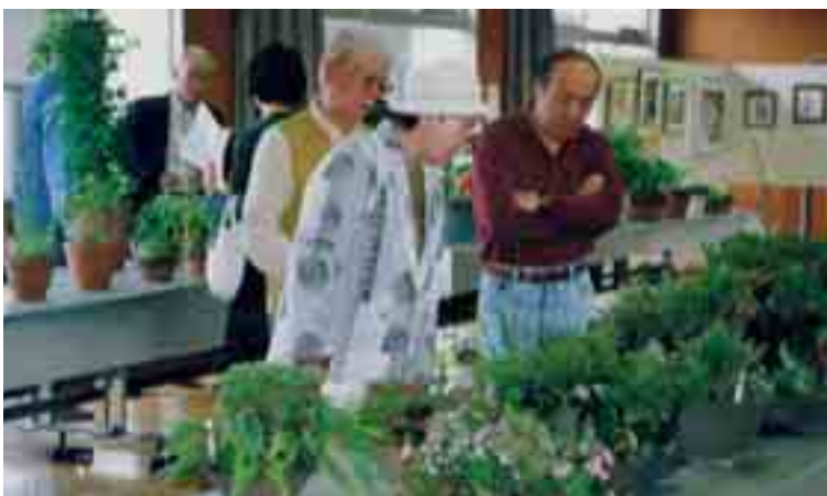
自然の繊細さに感心(野草展)

一日目の十一日には、ふるさとふれあい教室の学級生もこの野草展を見学、野草会員の説明を聞きながら草花を観察しました。