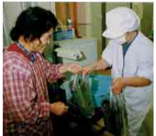
給食センターに持ち込まれるミネラル野菜

このため、ミネラル野菜を作付けしてくださる方を大募集しています。現在、健康な土づくりに取り組んでいる方はもちろんのこと、これから取り組みたいという方も大歓迎ですので、普及会に加入したい、健康ミネラル野菜を出荷したいという方は農林課までご連絡ください。土づくり推進員養成講座や健康ミネラル野菜普及会、家庭農園(西林に開設)などの健康な土づくりに関するお問い合わせや相談などがありましたら、どうぞお気軽にお寄せください。お待ちしております。