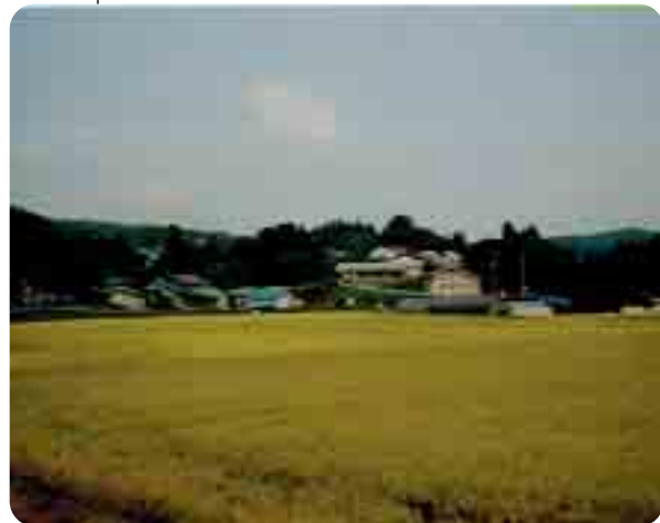
好きな西会津の風景(場所)は？ 実家(宝川)の風景 (故郷はいつまでもありがたいかなですわね。)