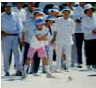
見てて!! 1回で通過!! (ゲートボール)