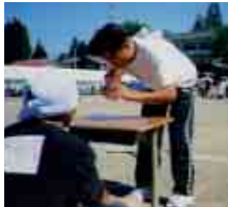
ひごろきたえし、こののど!! (ビール飲みリレー)