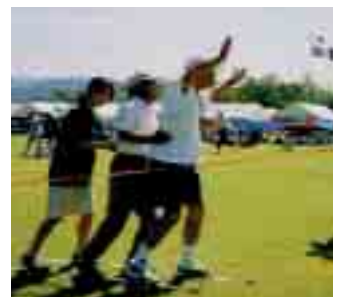
やった~1位だ (六足競争)