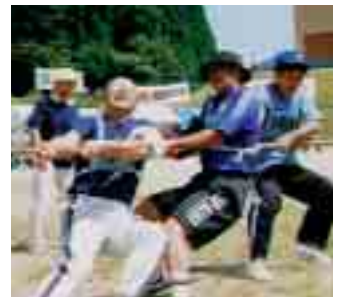
もう少しで勝ちだ！ (綱引き)