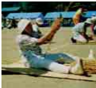
今でも縄ないはまかせて！ (縄ないリレー)