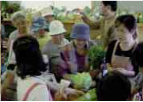
ミネラル野菜市（商業団地）