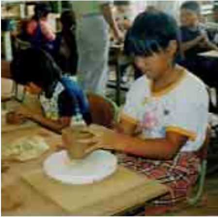
陶芸に挑戦する奥川小児童