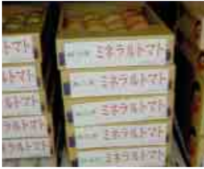
出荷される西会津ミネラルトマト