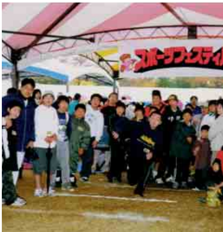
元プロ選手と一緒に子どもたちがストラックアウトで競いました