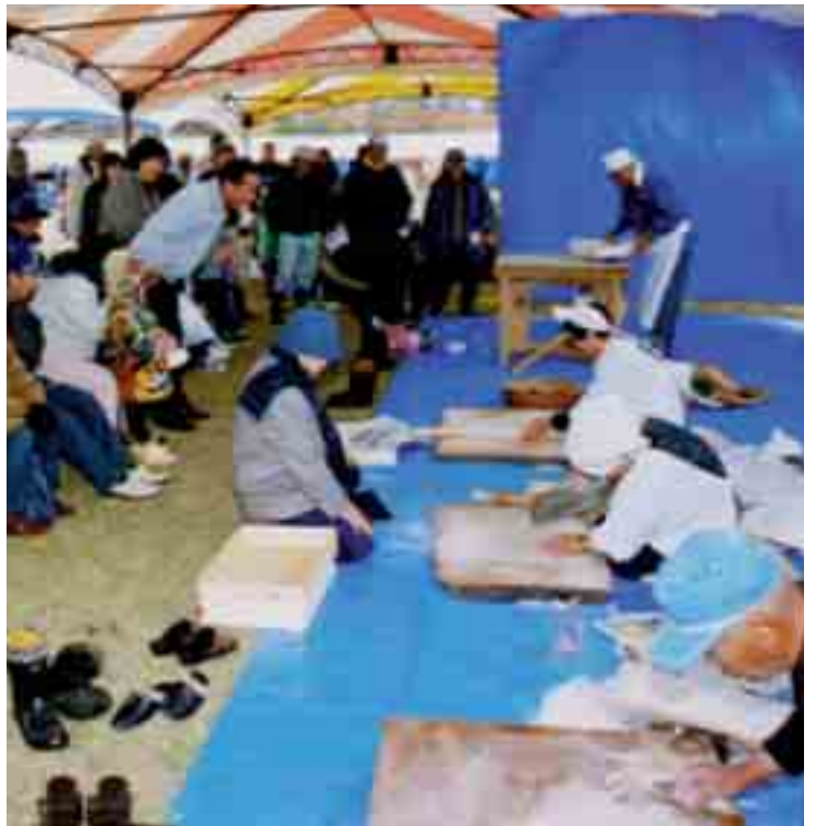
橋屋・萱本の名人によるソバ打ち実演試食会