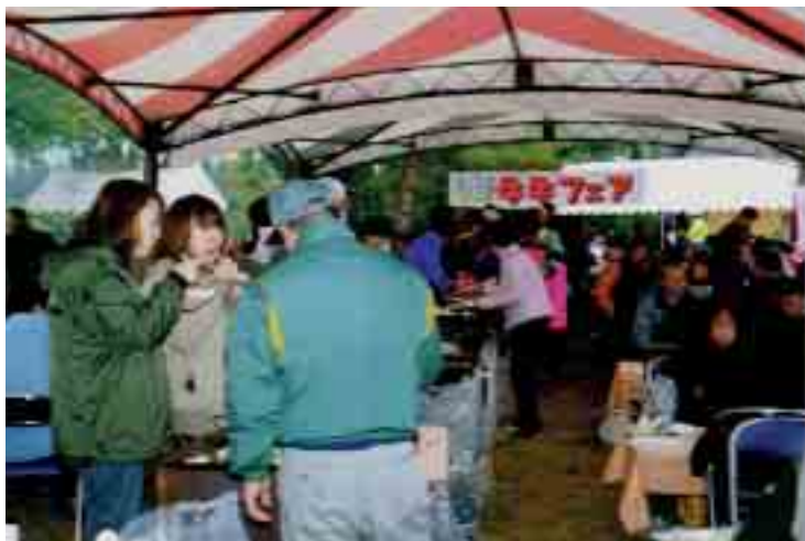
西会津産の牛をみなさんが堪能