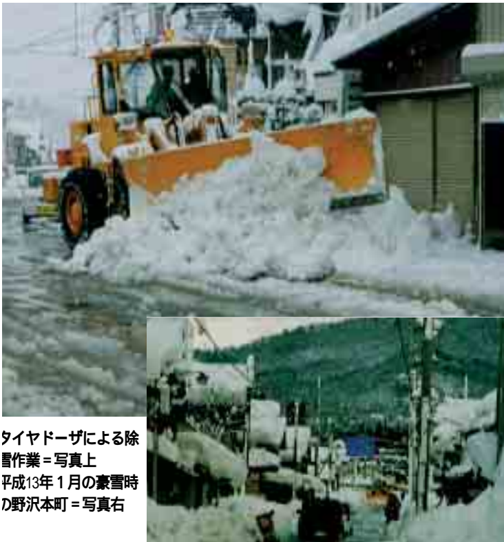
タイヤドーザによる除雪作業＝写真上 平成13年1月の豪雪時の野沢本町＝写真右

今年度の除雪計画は、新たに改良舗装を行った道路を除雪路線に追加したことから、車道は町道と除雪を受託した県道を合わせ二百三十路線、総延長が百六十七・二キロメートルとなりました。