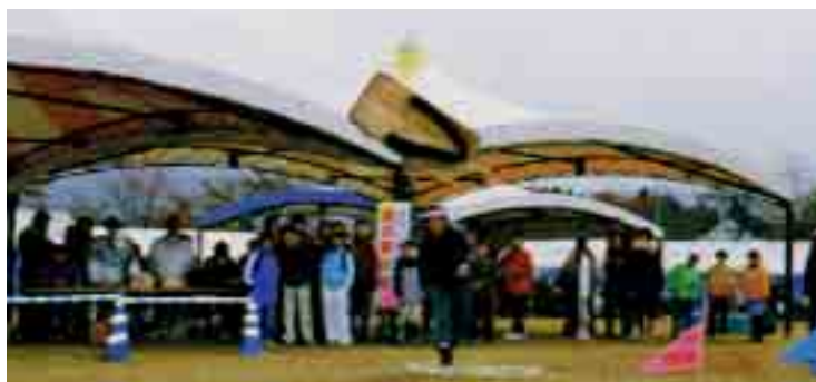
一般男子の部では10mを超える新記録が誕生