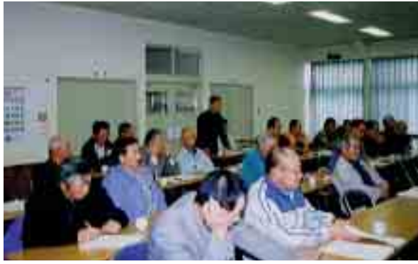
区長さんを対象に行われた除雪計画説明会（野沢・尾野本地区） ＝写真右

朝晩めっきり寒くなり、冬將軍の到来とともに積雪のたよりが聞こえるようになってきました。今年もいよいよ雪との闘いの始まりです。雪からみなさんの暮らしを守り、住みよいまちづくりを推進するため、生活道路の交通確保に向けて、今年も全力を傾けていきます。