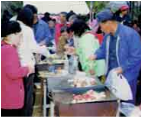
西会津産のおいしい牛肉です 牛牛フェア