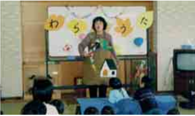
先生といっしょにうたいましょ（子育てサークル）

講演は三部構成で、1部と2部では、0歳児から小学5年生までの親子の参加があり、子どもと親のふれあいを中心としたわらべうたの実技を行い、親子で楽しい時間を過ごしました。また、3部では、指導者を対象とした実技講習会が行われ、参加した皆さんはわらべうたについて熱心に学んでいました。