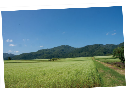
新郷地区・橋屋のそば畑