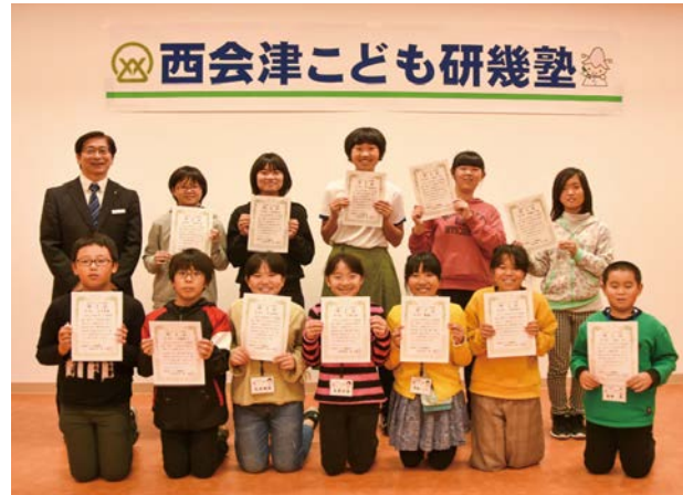
6月から町について学んできた「子ども研幾塾 第一期生」

塾生らは「西会津を知る、西会津の未来を学ぶ」をテーマに、6月から町の歴史や文化、自然、産業について体験活動を通じ学んできました。発表では、一人一人が塾で学んだことを写真を交えて説明し、最後には町の将来についての提言も行いました。塾生らは、今後も地域行事への参加などを通じ、町について学んでいくことを誓いました。