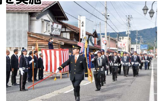
受礼台の町長へ敬礼をしながら分列行進する団員ら

10月20日、令和元年度の秋季消防検閲式が行われ、消防団員や女性消防隊員、役場消防隊員ら約300人が参加しました。野沢中央通りを分列行進した後、団員らは西中グラウンドで検閲式に臨み、規律訓練では日頃の練習の成果を発揮し、機敏な行進を披露しました。女性消防隊の皆さんによる身近なものを使った応急手当の実演や町消防表彰なども行われ、検閲式後に大槻橋の上流で行われた放水訓練では、団員らが放水手順の確認や円滑な連携活動の確認を行いました。