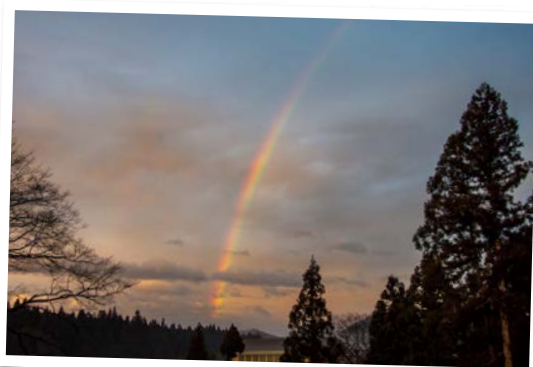
3月10日、夕焼け空に浮かんだ虹