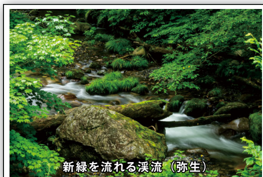
新緑を流れる溪流（弥生）