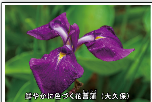
鮮やかに色づく花菖蒲（大久保）