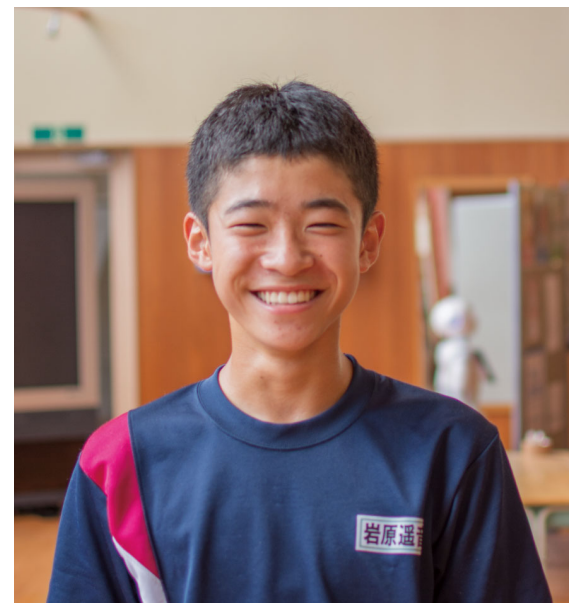
[西会津中3年・特設陸上部部長]