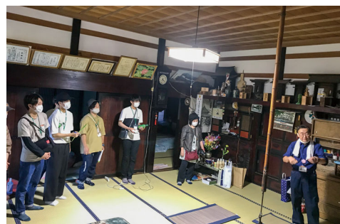
農家民泊のばらで民泊や曲家などを学ぶ

参加した大学生は、昨年から何度も来ている人だけでなく、初めて西会津町を知った学生も複数名参加しました。これをきっかけに、また大学生と地域とのつながりが広がり、今後も続いていけれ