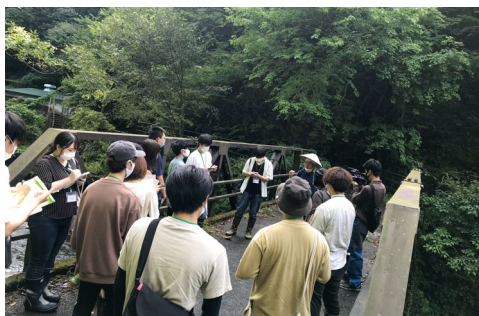
奥川第二発電所の歴史について学ぶ様子

今回の現地調査では、奥川地区の魅力を実際に見学することを目的に、福島大学岩崎ゼミの学生20名が来町し奥川地区で活動を行いました。この活動は、新型コロナウイルス感染症防止対策を行った上で実施しました。大学生にとっ