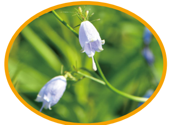
▲ツリガネニンジン