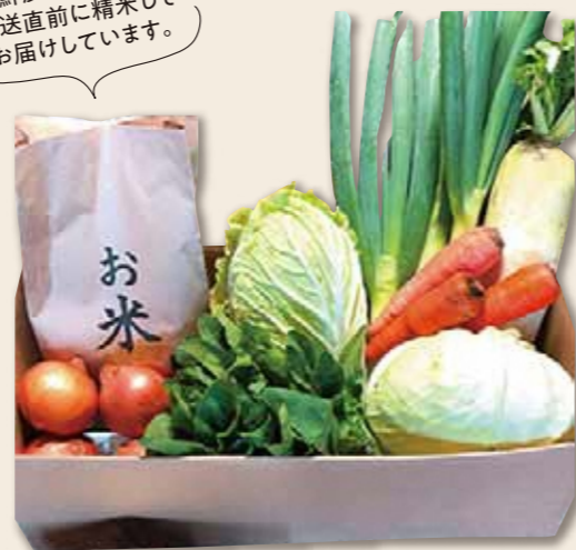
※セットは一例です

08 西会津ミネラルげんき米(2kg)+ 秋・冬野菜(2～3種類)セット(小) 定期便 3,380円+税/月 定期便 40,560円+税/年