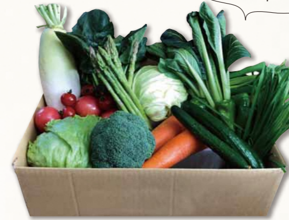
※写真は(大)セットの一例です

01 西会津ミネラル野菜セット(大) 4名様1週間分相当(10～12品目) 3,980円+税