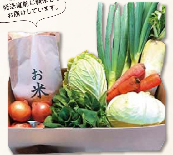
※セットは一例です