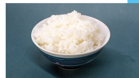
ふるさと応援寄附金額は昨年度1億6,000万円を突破。返礼品の町内産米は多くの寄附者から好評