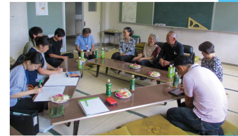
自治区での健康づくり座談会を開催。写真は弥平四郎での打合せの様子

町では一般会計のほか、5つの特別会計と2つの企業会計で事業を行っています。これらの令和3年度の予算総額は35億4,187万円となりました。