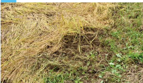
増加している鳥獣被害への対策事業を拡大。写真はイノシシ被害に遭った田んぼの様子