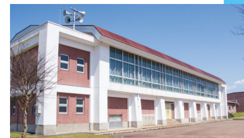
災害に備え、指定避難所になっているさゆり公園体育館の設備を整備