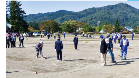
老人クラブへの支援や、ゲートボールなどの老人スポーツ大会を開催