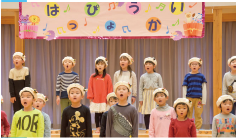
発表会で日頃の練習の成果を披露するこゆりこども園の園児たち