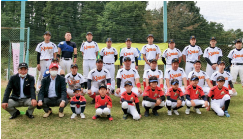
市町村対抗スポーツ大会への参加や、スポーツ少年団員の育成を支援