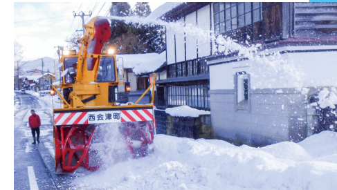
安心・安全な冬の暮らしを守るため計画的に除雪機械等を更新