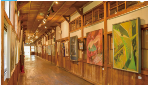
公募展などさまざまなイベントを開催している西会津国際芸術村