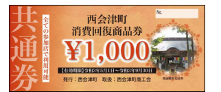
▲オレンジ色が共通券。2,000円分を配付