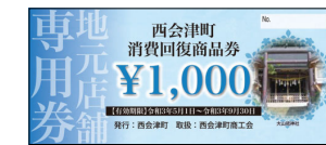
▲青色が地元店舗専用券。3,000円分を配付

○今回は、「地元店舗専用券」と「共通券」の2種類があります。使える店舗が異なりますので、十分にご注意ください（下記見本参照）。