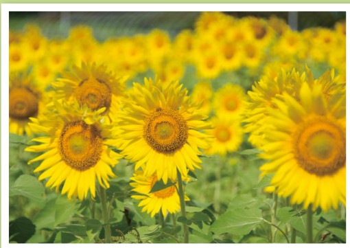
松尾のひまわり畑 (8月11日撮影)